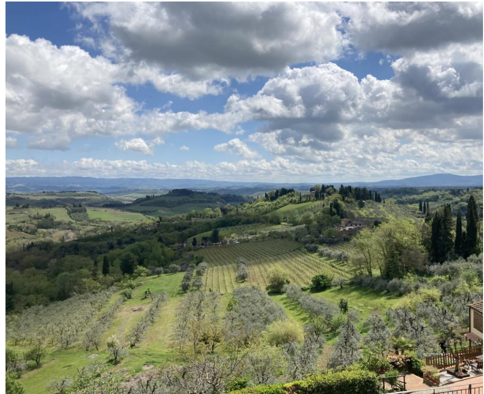
Pise, paysage de Toscane