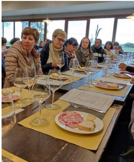
San Gimignano, Sienne, dégustation de Chianti